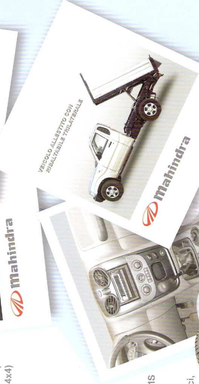
VEICOLI ALLESTITI CON SOPRALZABILI TRILATERALI